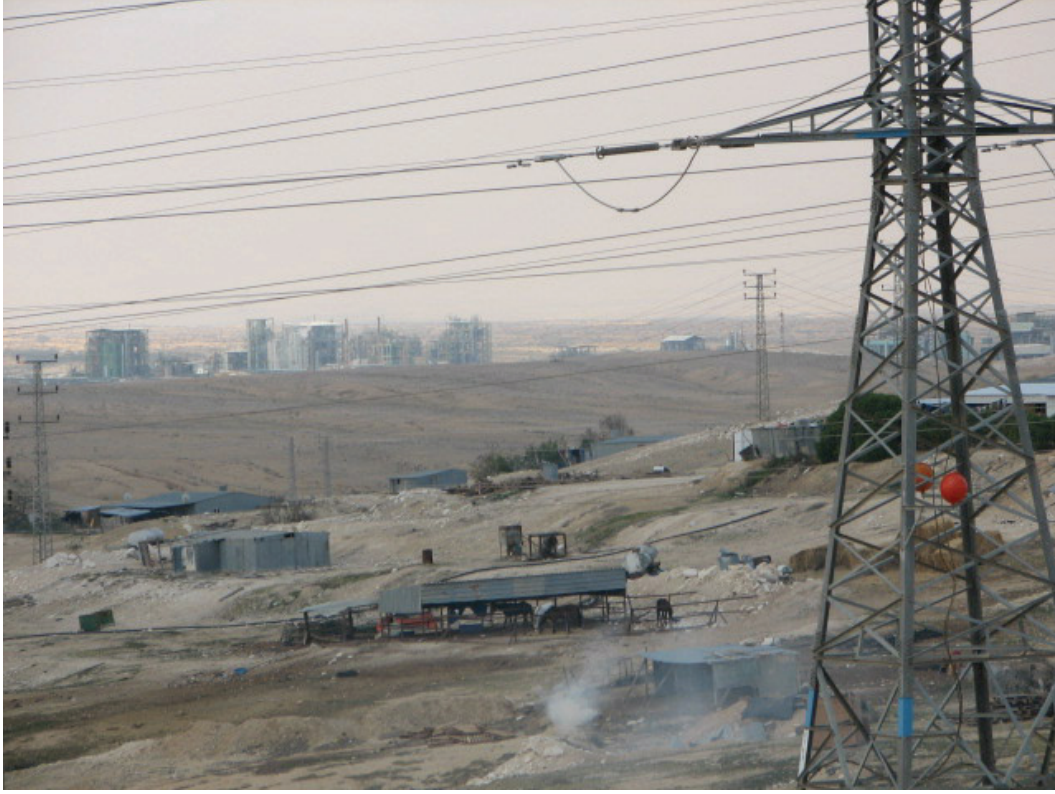
المنازل في قرية وادي النعم غير المعترف بها، تقع تحت الأسلاك والأعمدة الكهربائية وفي الخلفية مصانع رامات هوفاف.

ومثل هذه القرى البدوية هي فعلياً بلدات من الأكواخ، ويتم تشييدها على أراضي قاحلة غير قابلة للري والزراعة، ولا تصلها طرق مرصوفة، وهي محرومة من البنية التحتية الأساسية، وتتناقض أبلغ التناقض مع البلدات اليهودية المجاورة. وقرية ترابين الصانع البدوية غير المعترف بها، المبنية في الخمسينيات على أيدي قبيلة ترابين، التي خاض فيها باحثو هيومن رايتس ووتش وسط أحوال تصل إلى الكاحل لكي يبلغوا الأكواخ البدائية، تقع إلى جانب فيلات وشوارع عامرة بالأشجار في أحد أكثر البلدات الإسرائيلية ثراءً، وهي عومر. وفي عام 2000 وسعت عومر من نطاقها على حساب أراضي ترابين الصانع، لكن بدلاً من أن توفر لترابين مكاناً ضمن مجتمعها السكاني المنعزل، يحاول مجلس بلدية عومر بنشاط أن يخلي البدو من المنطقة من أجل تطوير وتسويق مخططات بمساكن جديدة. وأطلعت امرأة من سكان عومر هيومن رايتس ووتش على منشور ملون وزعته البلدية عام 1998 فيه خططها المستقبلية. وقالت المرأة: "الخريطة مصممة بناء على صورة جوية لعومر وعند موقع قرية ترابين توجد أسماء لشوارع جديدة ومدارس للأطفال وحدائق". وأضافت: "كان الأمر