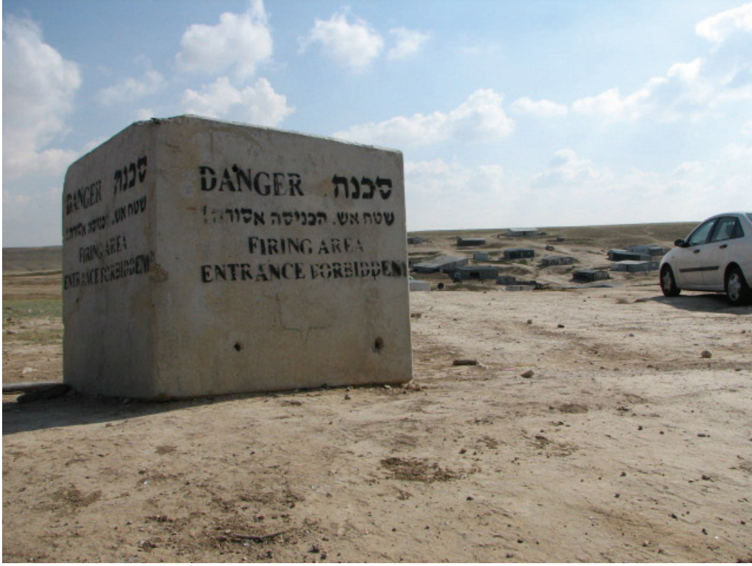
لافتة ممنوع الدخول تقع خلفها قرية غير معترف بها. وقال أحد سكان القرية غير المعترف بها المجاورة إن اللافتات ظهرت في العامين الماضيين، بعد عشرات الأعوام من تأسيس القرية. الصورة للوسي ماير، 2006

الحيران غير المعترف بها. وقال سالم أبو القيان لـ هيومن رايتس ووتش أنه على الرغم من أن القرية في مكانها هذا منذ عشرات الأعوام، ففي السنوات الأخيرة وضع الجيش لافتات لحظر الدخول. 134