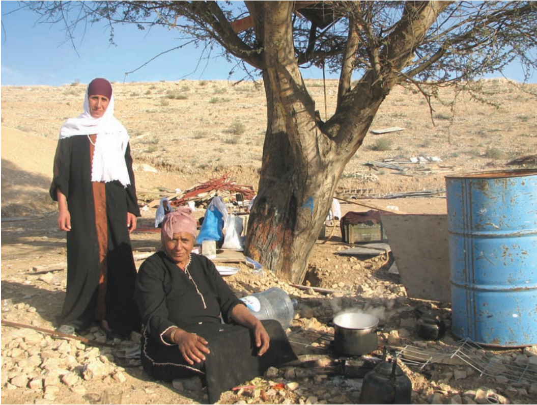
النساء في طويل يطهين في العراء بعد هدم بيوتهن.

في 8 و 11 ديسمبر/كانون الأول دخل مسؤولون من إدارة الأراضي الإسرائيلية مصحوبين بمئات من عناصر الشرطة والبلدوزارات والشاحنات إلى قرية طويل أبو جرول البدوية غير المعترف بها القريبة من تقاطع غورال في النقب وأزالوا 20 مبنى. وكانت هذه آخر مرة من بين ثماني مرات يهدم فيها مسؤولو إدارة الأراضي بيوت قبيلة الطلالقة في طويل أبو جرول في عام 2007.