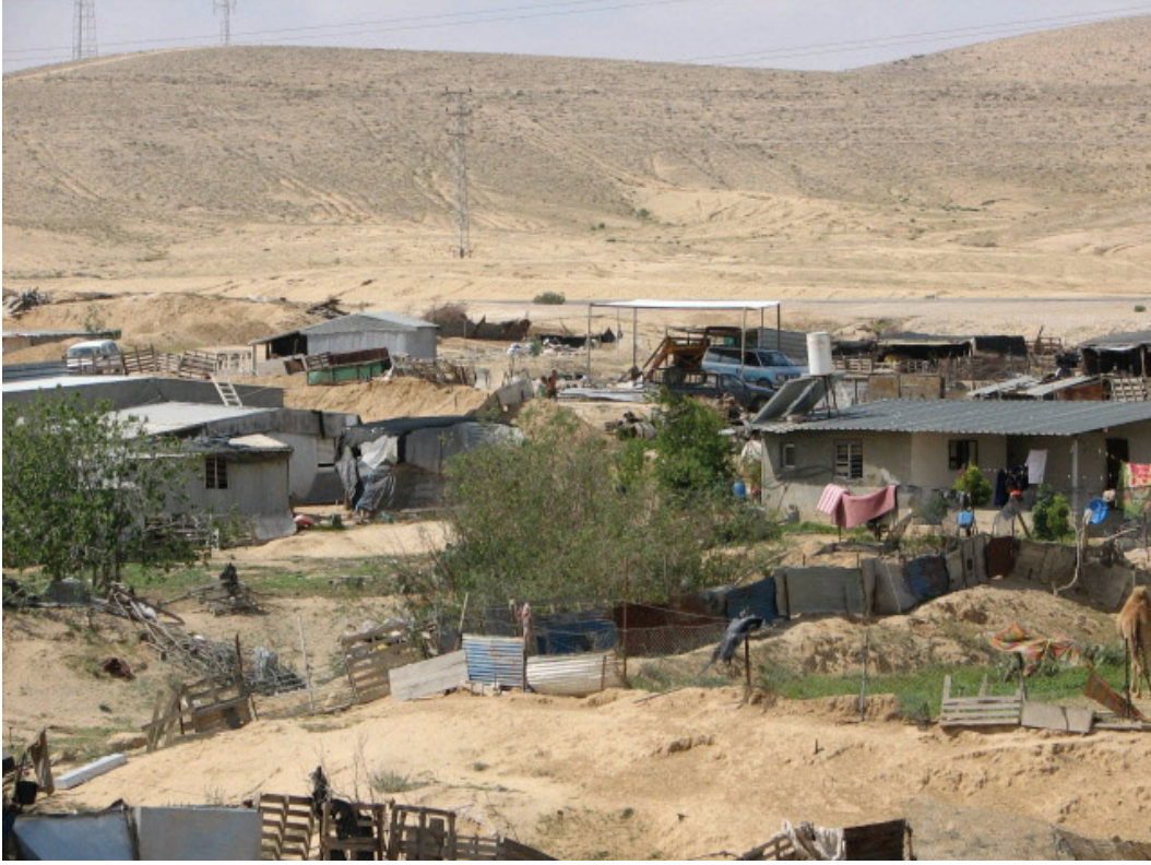
قرية السر غير المعترف بها. لوسي ماير، 2006

وتحدث نفس الساكن عن أثر تواجد القوات الكثيرة على أطفاله: