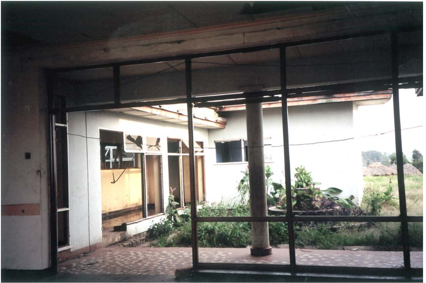
La résidence du gouverneur à Bunia a été détruite par une attaque ougandaise le 9 août 2002, tuant de nombreux civils.