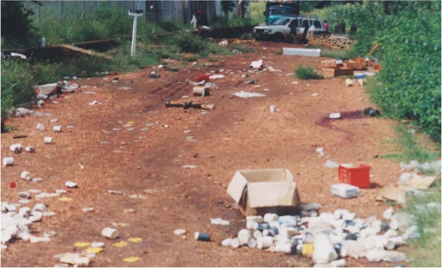
La destruction et le pillage pendant le massacre de Nyakunde, septembre 2002