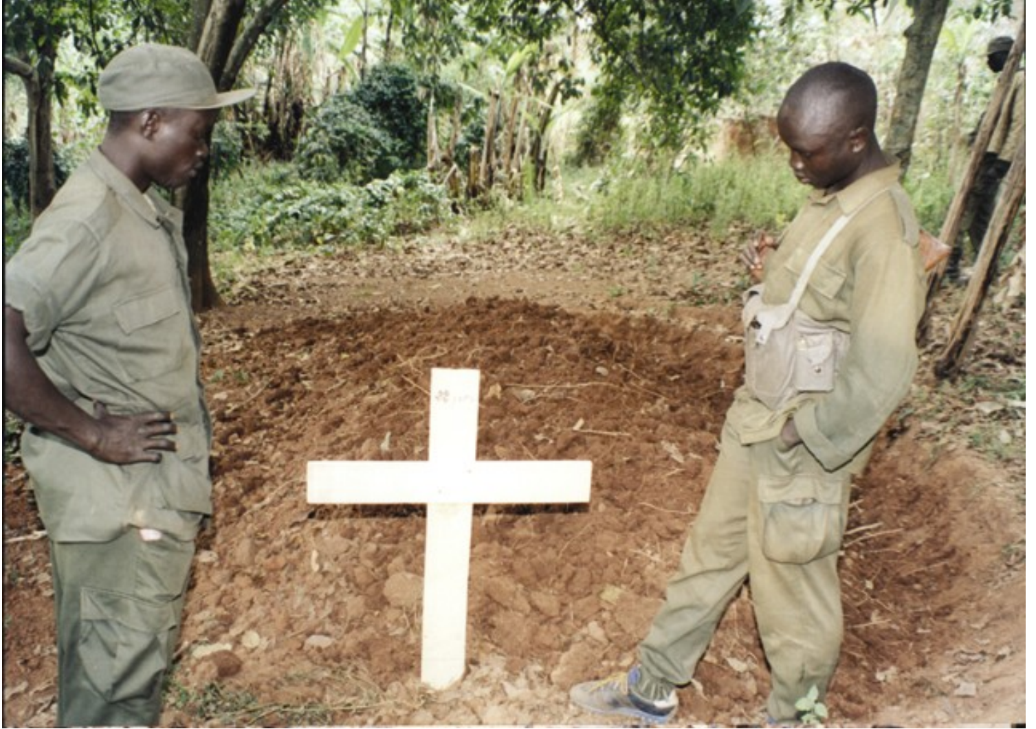
Deux soldats ougandais regardent une fosse commune à Drodro, avril 2003.