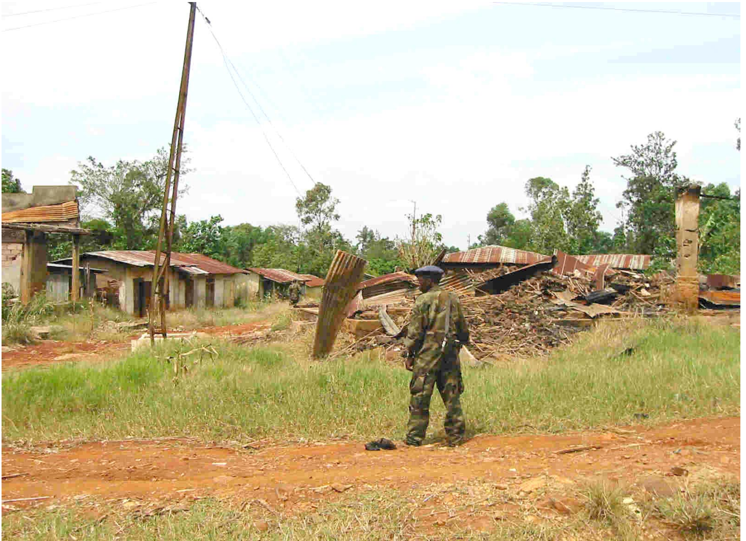
Un soldat de l'UPC se tient au milieu de la ville désertée de Nyakunde, deux mois après le massacre de Nyakunde, décembre 2002.