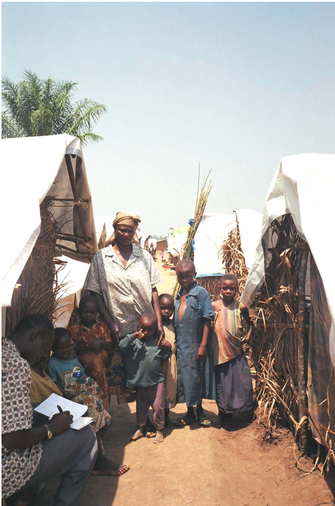
Des personnes déplacées à Oicha, ayant fui les combats en Ituri, 2003.