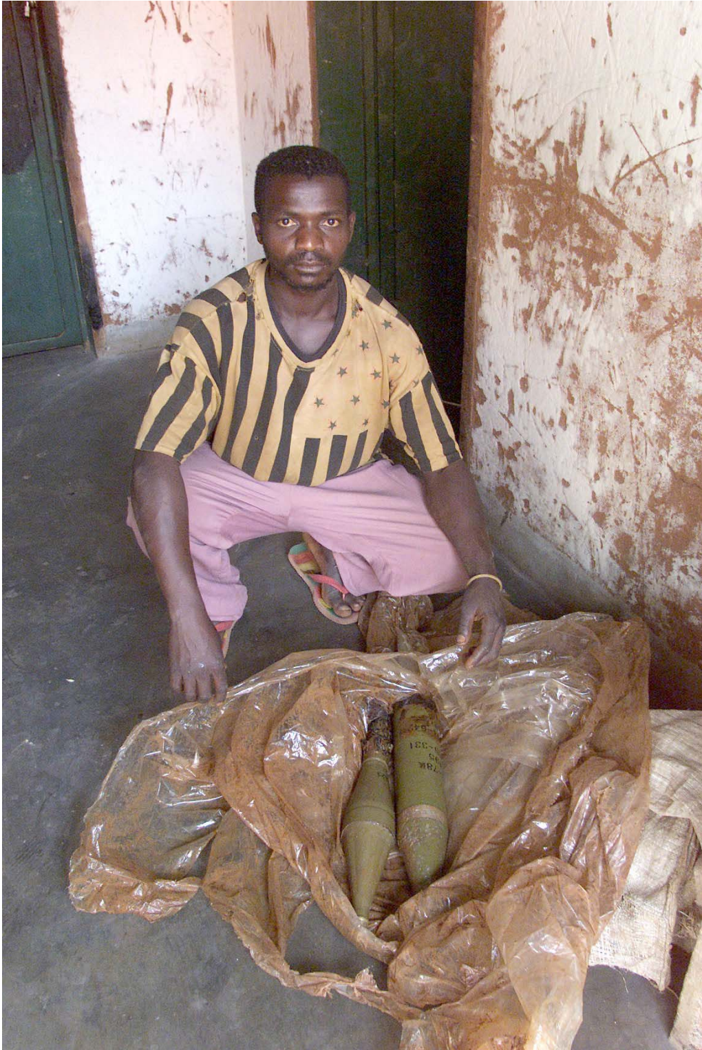
Un homme lendu montre des munitions, 2002.