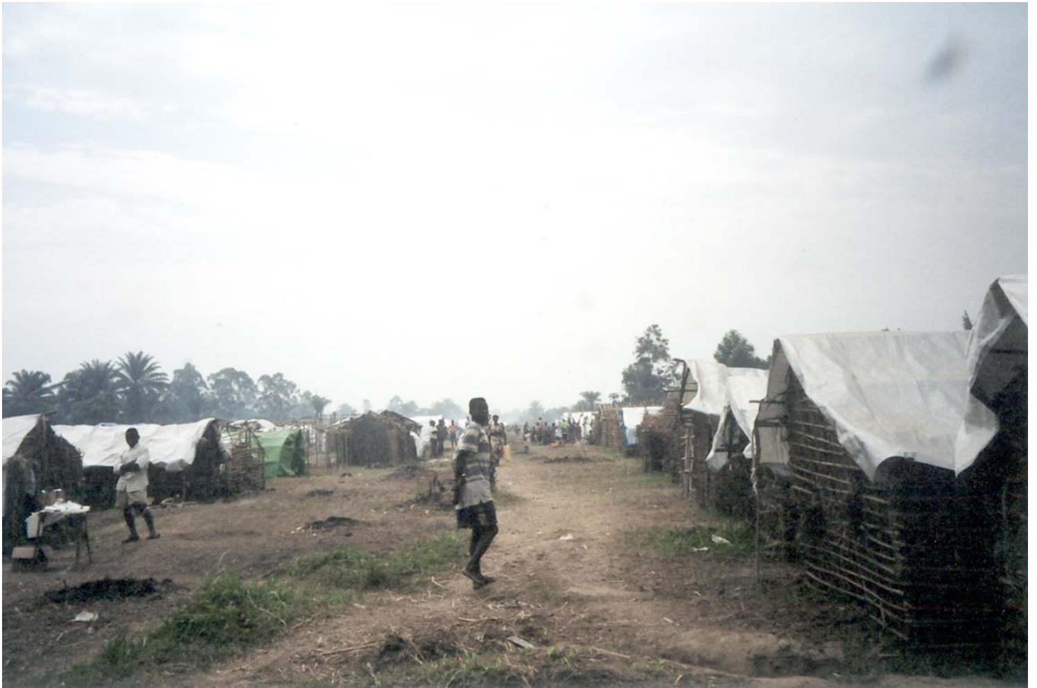
Un camp de personnes déplacées à Oicha, pour des milliers de civils fuyant les combats en Ituri.