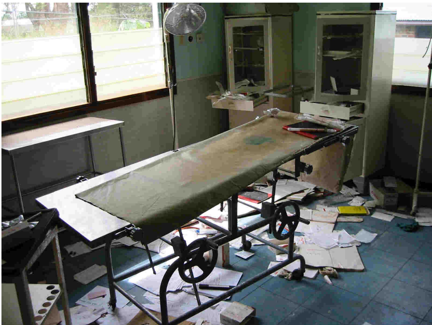
La salle d'opération de l'hôpital de Nyakunde où 14 Hema terrorisés se sont cachés avant d'être découverts et tués quelques jours plus tard, septembre 2002.