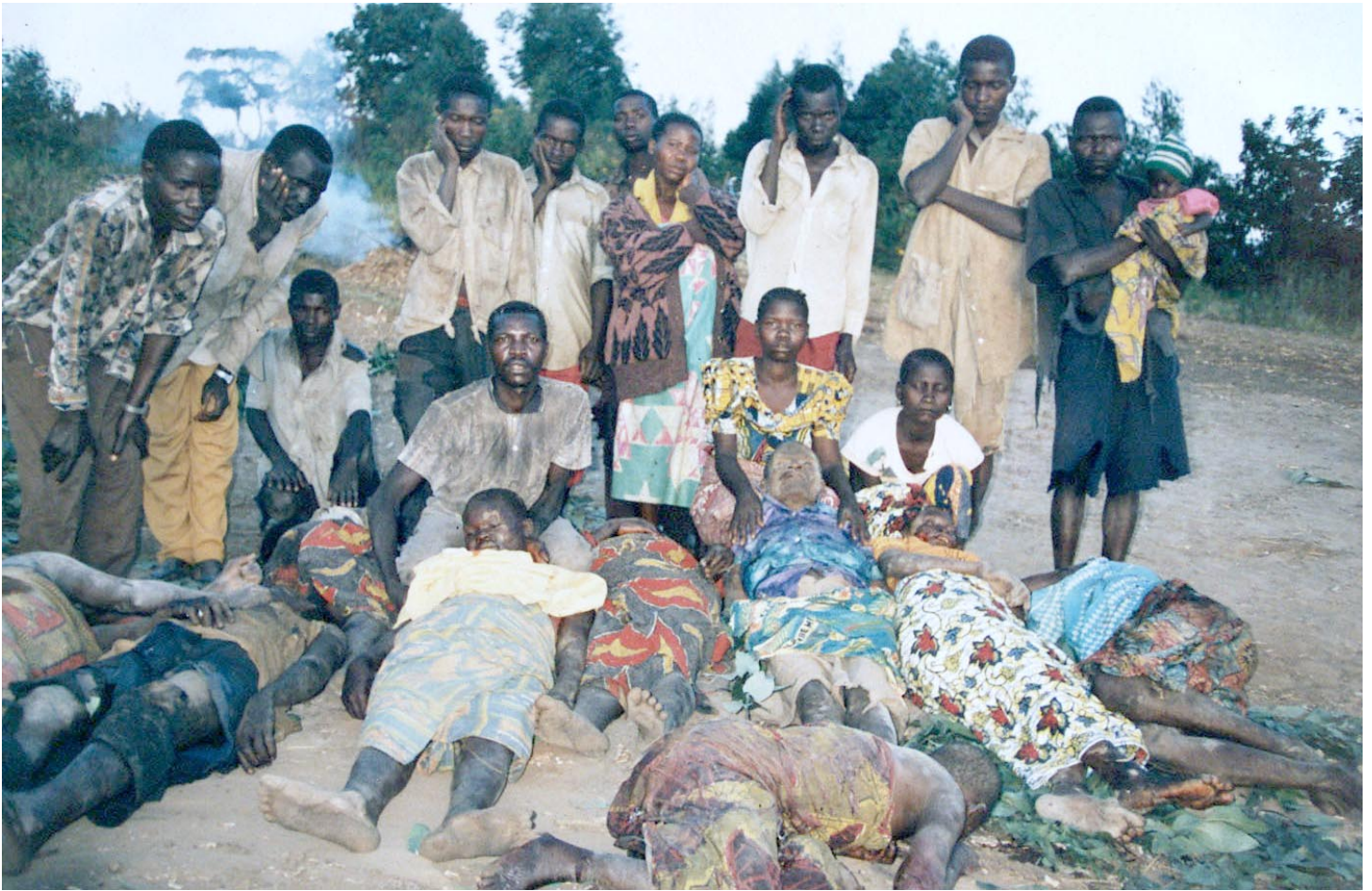
Des civils lendu massacrés par les Hema dans le territoire de Djugu, 2002.