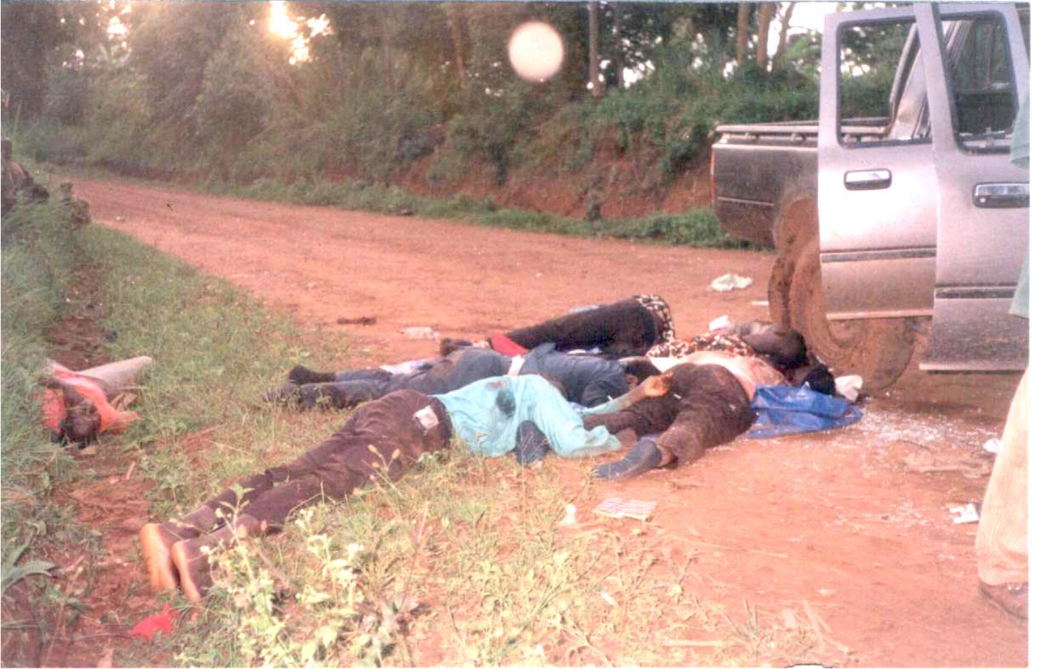
Assassinat du gouverneur Eneko près de Mahagi, novembre 2002.