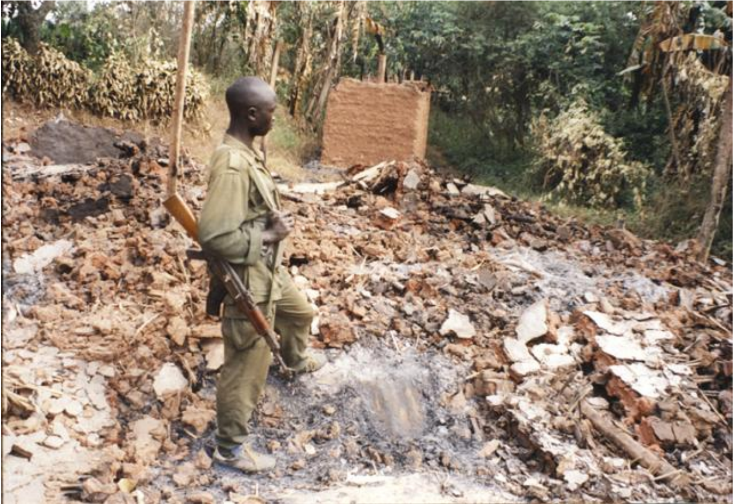
Un soldat ougandais regarde les restes d'un village congolais, où des personnes ont été enterrées vivantes dans leurs maisons, avril 2003.