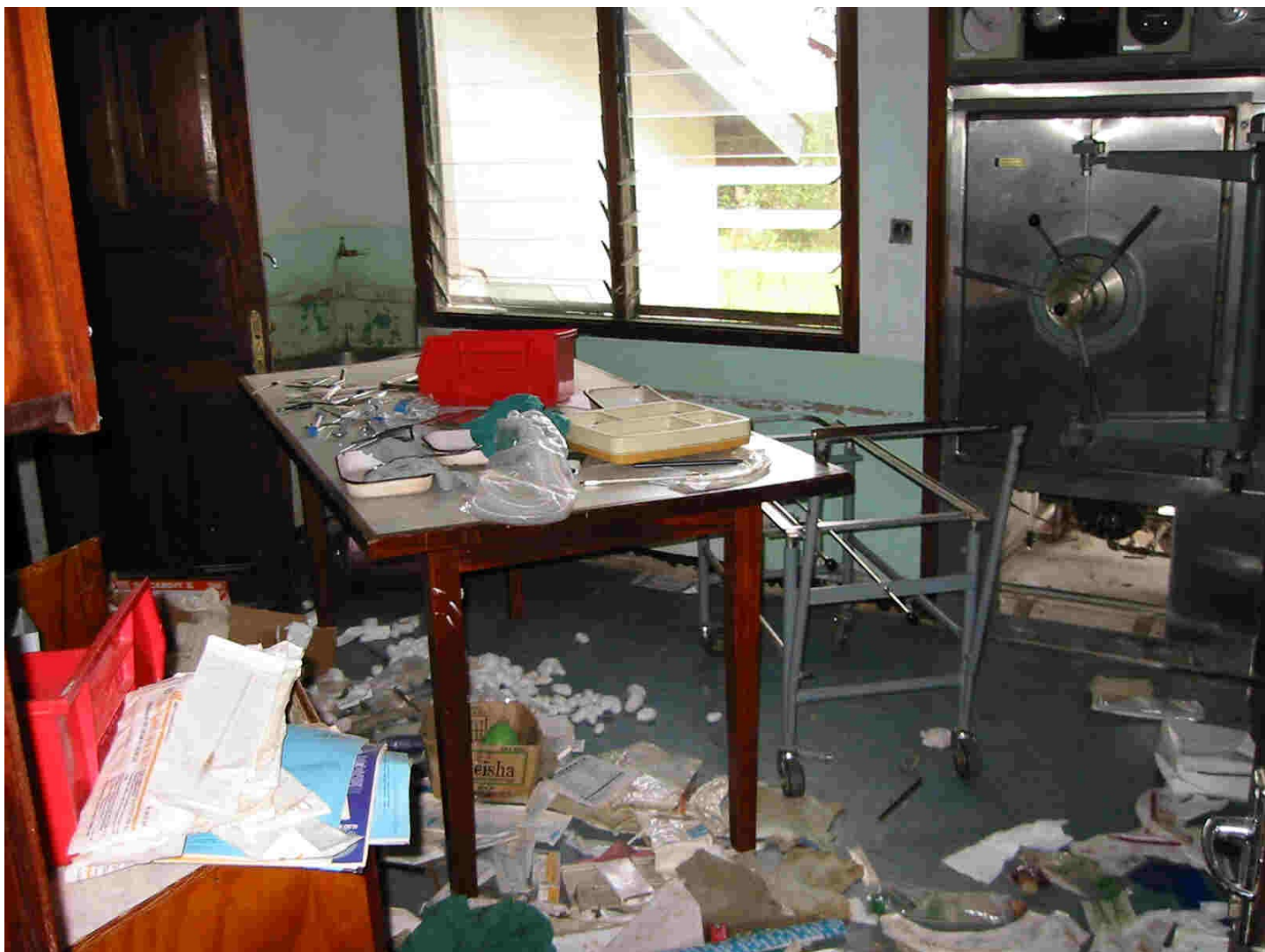
L'hôpital de Nyakunde fut pillé et détruit pendant le massacre de septembre 2002.