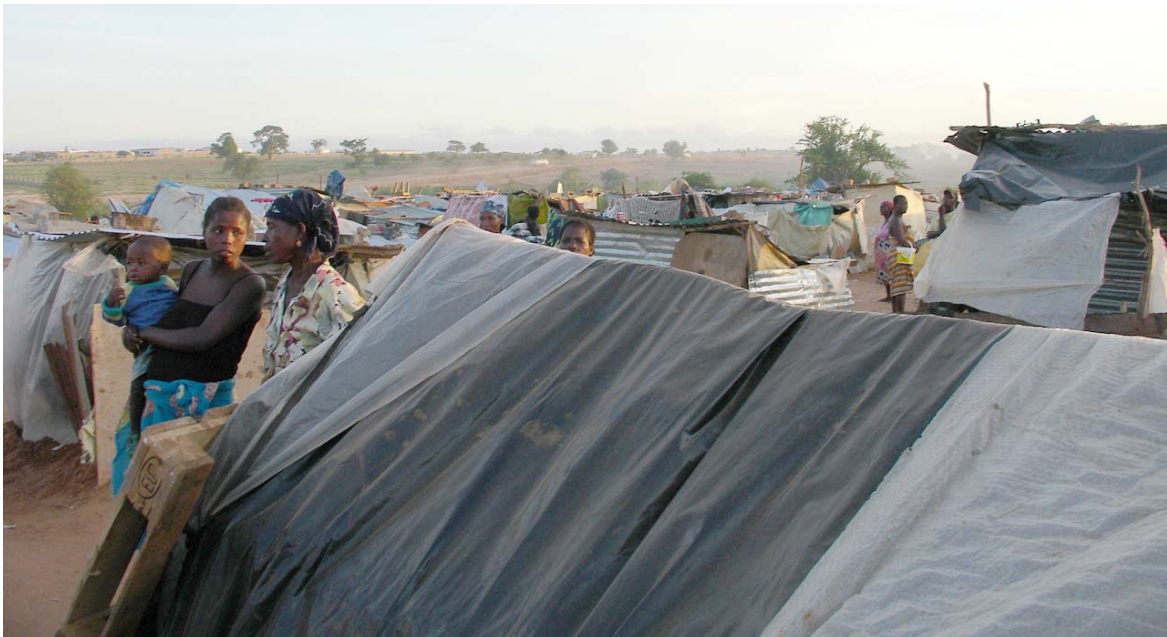
Pessoas despejadas de Cambamba II vivendo em barracas depois de uma série de operações de despejo em que demoliram as suas residências originais.

duas mulheres despejadas de Cambamba II disseram-nos “[a] gente não tem para onde ir, então ficamos aqui à espera.” 139 Em Agosto de 2006, a Human Rights Watch testemunhou as condições precárias em que as pessoas ainda viviam durante a estação fria em Angola. Nesse momento, mais de 100 famílias esperavam ainda por uma decisão do Governo a respeito da indemnização ou de um realojamento alternativo para as famílias afectadas. Quando a Human Rights Watch visitou novamente o local em princípios de Dezembro de 2006, a situação não se tinha alterado. O Governo não havia proporcionado qualquer abrigo de emergência ou assistência a estas famílias.