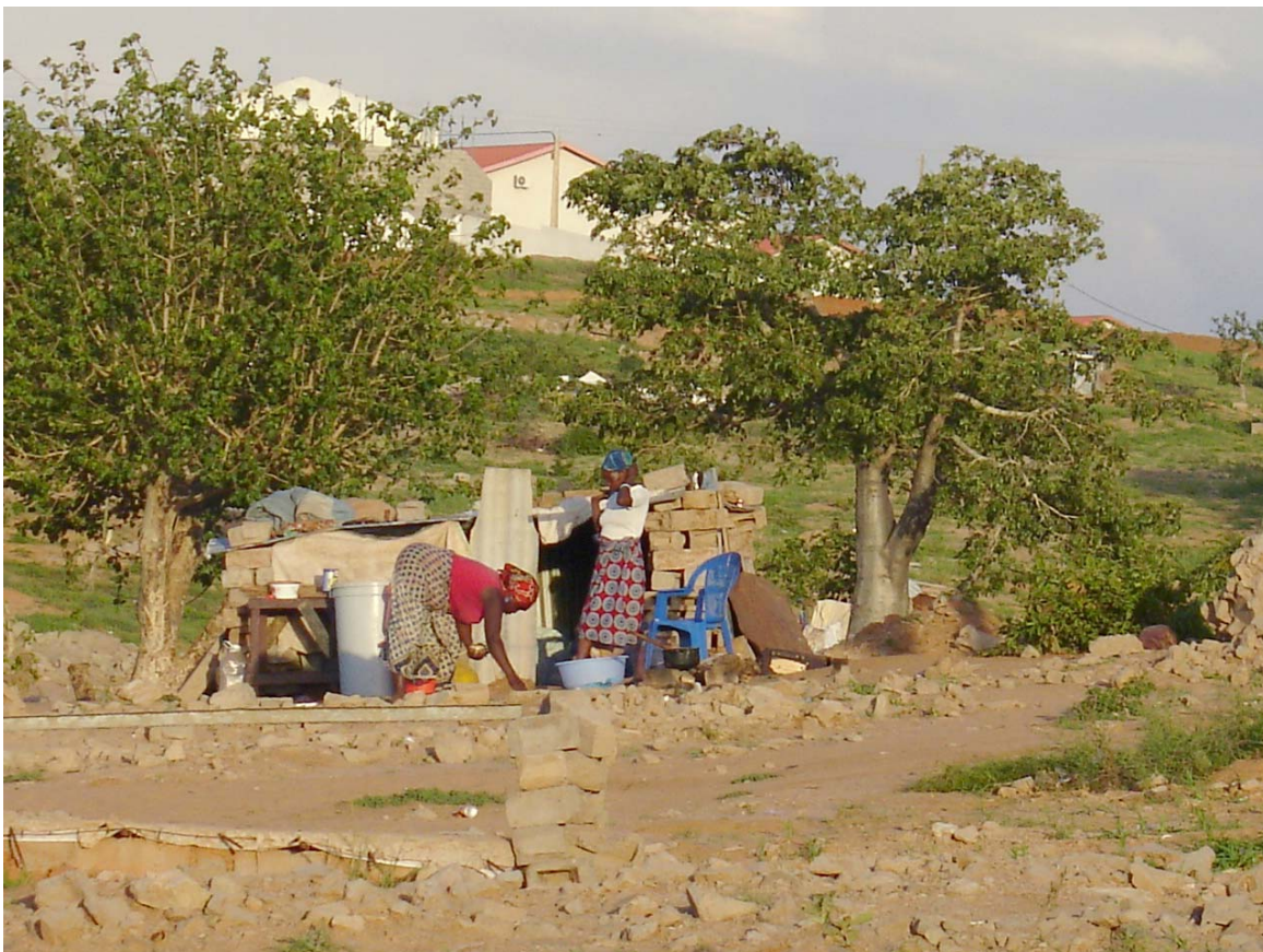
Pessoas despejadas no bairro Cambamba I

Os moradores mais idosos, as mulheres e mesmo as crianças que não tiveram os meios ou a capacidade para retirar objectos maiores ou mais pesados, como camas e fogões, perderam tudo. Uma mulher contou à Human Rights Watch que, quando viu a polícia e os bulldozers , correu para proteger os seus filhos e deixou tudo para trás: “Ficámos só com as roupas do corpo.” 73